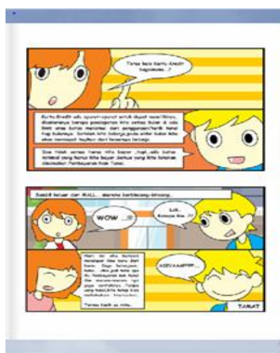
Gambar 7. Halaman penutup komik digital Ekonomi

Pada tahap pengembangan banyak dilakukan perbaikan-perbaikan agar media layak digunakan sebagai media pendukung dalam pembelajaran. Tahap ini diawali dengan mengajukan rancangan media untuk ditelaah para ahli, kemudian menghasilkan revisi sesuai dengan masukan telaah para ahli sehingga menjadi media setelah direvisi. Setelah media direvisi sesuai telaah ahli, langkah selanjutnya dilakukan validasi untuk mengetahui kelayakan media berbentuk komik digital sebelum dilakukan uji coba terbatas. Ketika media dinyatakan valid oleh para ahli, peneliti melakukan uji coba pada kelas X IPA3 SMA Negeri 1 Trawas Kabupaten Mojokerto. Berdasarkan hasil validasi para ahli, data yang disajikan dianalisis dengan menggunakan teknik analisis deskriptif kuantitatif, yaitu dengan cara mengubah data kuantitatif menjadi bentuk persentase yang kemudian diinterpretasikan dengan kalimat yang bersifat kualitatif, terdiri dari ahli bahan ajar dan ahli materi.