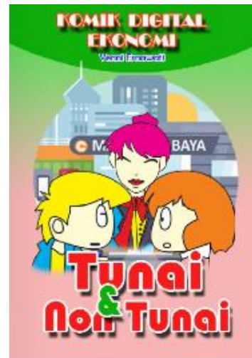
Gambar 4. Halaman sampul komik digital Ekonomi

Sedangkan sebagian desain komik digital ekonomi dapat dilihat dengan beberapa contoh gambar dibawah ini: