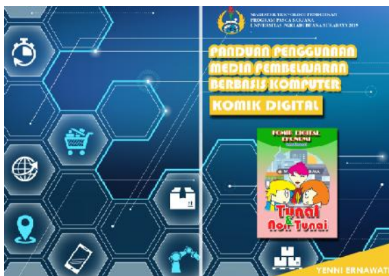
Gambar 2. Halaman sampul buku panduan penggunaan media pembelajaran komik digital

Berikut merupakan desain buku panduan penggunaan komik digital ekonomi.