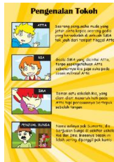
Gambar 5. Bagian Pendahuluan komik digital Ekonomi berisi pengenalan tokoh

Halaman sampul dibuat semenarik mungkin dengan menggunakan pilihan warna yang cerah. Halaman sampul yang menarik diharapkan akan menimbulkan rasa ingin tahu siswa terhadap media pembelajaran komik digital.