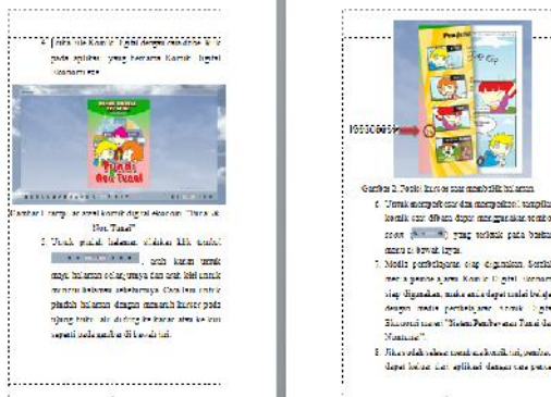
Gambar 3. Isi Panduan penggunaan media pembelajaran komik digital Ekonomi

Dalam buku panduan ini berisi bagaimana cara penggunaan komik digital ekonomi.