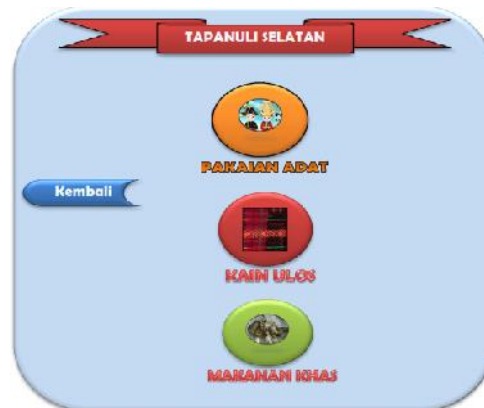
Gambar 3 Interface Menu Pakaian Adat, Kain Ulos dan Makanan Khas

Merupakan tampilan dari antar muka menu Pakaian Adat, Kain Ulos dan Makanan Khas yang berfungsi untuk melihat materi dari Pakaian Adat, Kain Ulos dan Makanan Khas dari daerah yang dipilih.