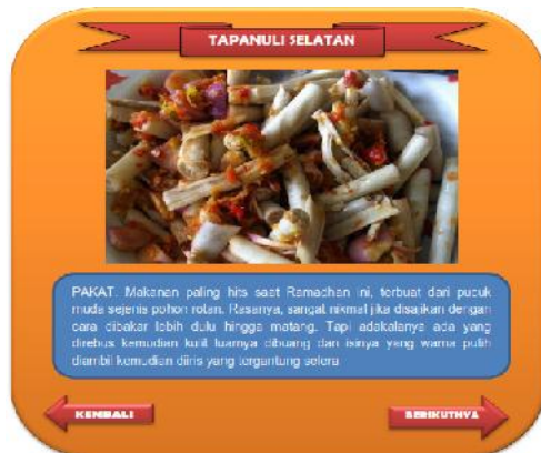
Gambar 6 Interface Makanan Khas

Merupakan tampilan dari antar muka menu Makanan Khas. Disini akan ditampilkan gambar dan penjelasan dari Makanan Khas yang kita pilih.