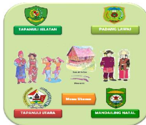
Gambar 3 Interface Menu Kabupaten

Interface Menu Kabupaten merupakan tampilan dari antar muka menu Kabupaten yang berfungsi untuk memilih budaya Kabupaten mana yang mau kita pilih.