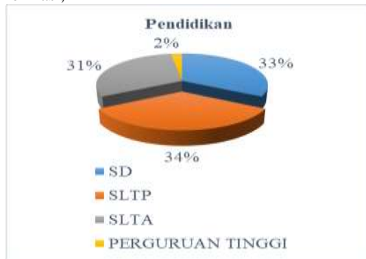
Gambar pendidikan KPM

Berdasarkan dari pendidikannya, diperoleh informasi,