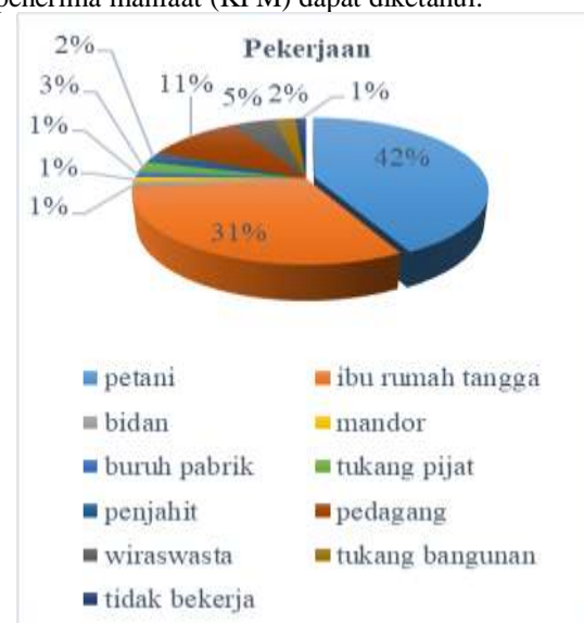
Gambar pekerjaan KPM

Sementara, pada sisi pekerjaan keluarga penerima manfaat (KPM) dapat diketahui: