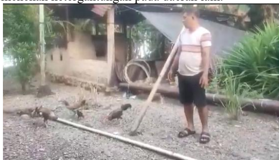
Gambar 1. Kegiatan usaha ternak ayam kampung di Desa Bulude

Sebagai daerah Terluar-Terdepan-Tertinggal (3T) Kabupaten Talaud masih bergantung pada wilayah lain. Ketergantungan pasokan pangan terhadap daerah lain tidak mampu memastikan ketersediaan serta keamanannya. Kondisi tersebut dapat terpengaruhi oleh berbagai faktor, seperti hambatan distribusi atau pengiriman, fluktuasi harga, dan sebagainya (Rohman et al., 2021). Oleh sebab itu, dibutuhkan solusi alternative dalam upaya mencukupi kebutuhan pangan secara swadaya demi menekan ketergantungan pada daerah lain.