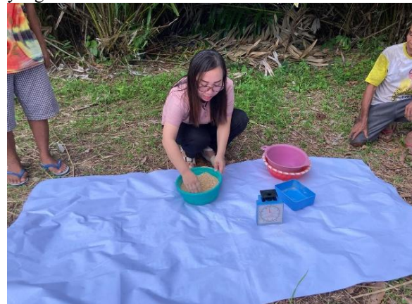
Gambar 6. Pelatihan pembuatan pakan ayam kampung

et al., 2025). Bahan pakan alami, seperti dedak, jagung yang telah digiling, singkong, serta hijauan, dapat dimanfaatkan karena ketersediaannya relatif mudah dan kandungan gizinya menunjang kebutuhan ternak. Di samping itu, tambahan pakan buatan berupa konsentrat diperlukan guna mencukupi kebutuhan protein dan energi. Nasrullah et al. (2020) menyatakan bahwa komposisi pakan yang proporsional bukan hanya berdampak pada peningkatan produktivitas ayam kampung, melainkan juga berpengaruh terhadap mutu daging dan telur yang dihasilkan.