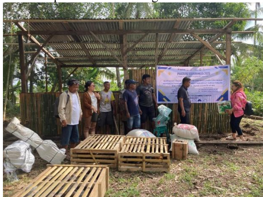
Gambar 5. Penyediaan Alat dan Bahan

Setelah dilakukan kegiatan sosialisasi kemudian dilanjutkan dengan kegiatan pelatihan. Kegiatan pelatihan diawali dengan penyiapan materi serta perlengkapan yang akan dimanfaatkan oleh mitra sasaran oleh tim pelaksana (Gambar 5). Setelah mengikuti kegiatan sosialisasi tentang pembuatan kandang yang sesuai kemudian mitra sasaran dengan menggunakan bahan-bahan yang tersedia mulai melakukan pembuatan kandang..