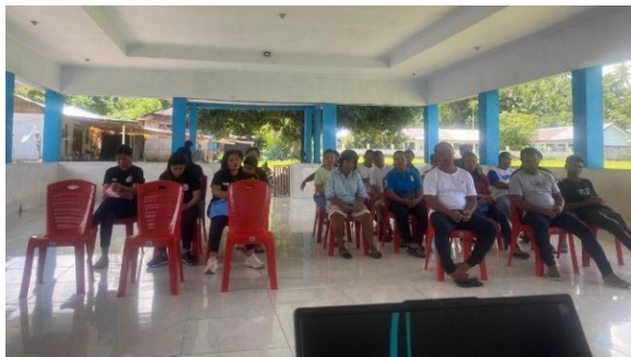
Gambar 4. Kegiatan Sosialisasi Pemeliharaan Ayam Kampung Terintegrasi Kegiatan Pertanian

Setelah dilakukan kegiatan sosialisasi kemudian dilanjutkan dengan kegiatan pelatihan. Kegiatan pelatihan diawali dengan penyiapan materi serta perlengkapan yang akan dimanfaatkan oleh mitra sasaran oleh tim pelaksana (Gambar 5). Setelah mengikuti kegiatan sosialisasi tentang pembuatan kandang yang sesuai kemudian mitra sasaran dengan menggunakan bahan-bahan yang tersedia mulai melakukan pembuatan kandang..