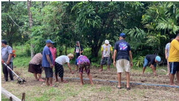
Gambar 9. Proses Penanaman Bibit Jagung

Sistem integrasi antara kegiatan peternakan dan pertanian yang akan diterapkan oleh mitra sasaran yaitu tersedianya bahan baku utama pembuatan pakan ayam kampung berupa jagung, dan ketersediaan pupuk kandang dari kotoran ayam yang dapat digunakan dalam kegiatan pertanian.