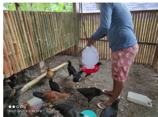
Gambar 7. Pelatihan Penanganan Optimalisasi Kesehatan Ayam Kampung