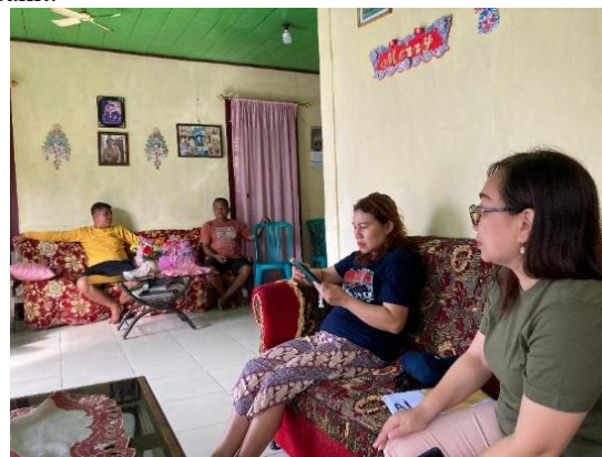
Gambar 3. Kegiatan Penyamaan Persepsi

Pelaksanaan kegiatan sosialisasi yang telah dilakukan telah dapat meningkatkan pengetahuan mitra tentang cara ternak ayam kampung baik dari segi kesehatan maupun kecukupan gizi (Gambar 4). Selain itu melalui kegiatan sosialisasi ini juga telah dapat meningkatkan pengetahuan mitra tentang pembuatan kandang yang sesuai untuk ternak ayam kampung dalam jumlah yang lebih besar. Mitra yang dahulunya memiliki pemahaman yang masih rendah tentang cara pemeliharaan ayam kampung dalam jumlah yang besar telah dapat mengerti dan memahami mekanisme pemeliharaan bahkan sampai pada bagaimana menangani ayam peliharaan ketika sakit.