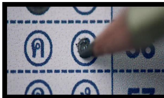
Gambar 2. Kunci Jawaban

Secara denotasi, terlihat Lynn adalah seorang siswa SMA pada umumnya yang sedang menempuh pendidikan, namun dia seorang siswa SMA yang unik dan berbeda. Ciri khas karakter Lynn memberikan solusi dalam membantu nilai-nilai temannya walaupun keputusan tersebut menyimpang pada peraturan sistem sekolah dan merancang strategi (usaha les piano) adalah bentuk keberanian menantang diri untuk mencoba sesuatu hal yang baru, melalui segi moralitas hal ini pantang untuk dilakukan bagi seorang siswa SMA, resiko berbahaya seperti dikeluarkan dari sekolah dan mendapat peringatan dropout dari pihak sekolah. Nilai pendidikan karakter seorang Lynn terlihat menonjol bagaimana kerja sama antarindividu menjalankan strategi usaha les piano berjalan lancar. Lynn berargumen dalam memberikan saran, solusi, susunan rencana yang matang semuanya tertuang dan tersusun rapi meskipun akhirnya perbuatan Lynn dan teman-temannya terbongkar. Pada Gambar 1 dan Gambar 2, terlihat adegan Lynn mulai memainkan tangannya (chord piano) untuk memperlihatkan pada teman-temannya bahwa itu adalah kunci jawaban ujian.