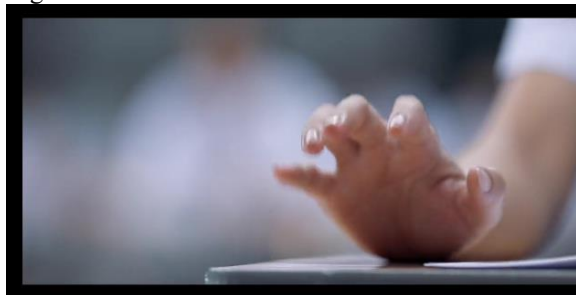
Gambar 1. Strategi Chord Piano

Film ini menggambarkan berbagai aspek pendidikan, seperti tekanan untuk mendapatkan nilai sempurna, perbedaan sumber daya antara siswa, dan bagaimana sistem pendidikan dapat dimanipulasi oleh mereka yang memiliki uang. Bagian selanjutnya memperlihatkan secara spesifik bagaimana strategi latihan les piano tersebut berjalan dengan lancar dan baik pada saat ujian pertengahan semester berlangsung, peserta didik melakukan setiap taktik mereka dengan teliti tanpa ketahuan oleh pengawas ujian, meski pematangan strategi itu berjalan dengan baik, pada akhirnya rahasia yang tersembunyi terkuak dengan perlahan dan menyebabkan dampak negatif.