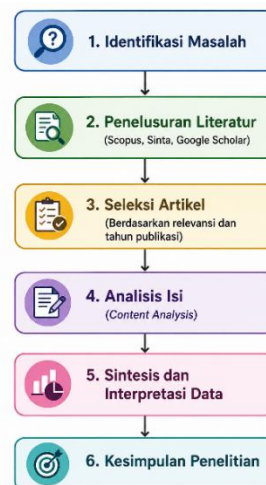
Gambar 1. Alur Penelitian Studi Literatur (Faiz, Pratama, and Kurniawaty 2022)

Teknik pengumpulan data dilakukan melalui studi dokumentasi dengan cara mengidentifikasi, mengklasifikasi, dan menyeleksi artikel yang relevan dengan fokus penelitian. Proses penelusuran artikel dilakukan melalui database Scopus, Google Scholar, Garuda, dan Sinta menggunakan kombinasi kata kunci tertentu agar diperoleh artikel yang sesuai dengan tema penelitian. Artikel yang ditemukan kemudian diseleksi berdasarkan kesesuaian topik, reputasi jurnal, tahun publikasi, dan keterkaitannya dengan pendidikan karakter berbasis budaya lokal di era digital, sedangkan artikel yang tidak relevan dieliminasi dari proses analisis. Data yang telah terkumpul dianalisis menggunakan teknik content analysis untuk menemukan hubungan konseptual antara pendidikan karakter, transformasi digital, dan nilai-nilai Pancasila. Alur penelitian dilakukan secara sistematis mulai dari identifikasi masalah, penelusuran dan seleksi artikel, analisis isi, sintesis data, hingga penarikan kesimpulan penelitian. Selain itu, penelitian juga menggunakan analisis bibliometrik sederhana dengan bantuan VOSviewer untuk memetakan tren penelitian pendidikan karakter digital dan menunjukkan bahwa Pancasila masih belum banyak dikaji sebagai tema dominan dalam penelitian pendidikan karakter di era digital